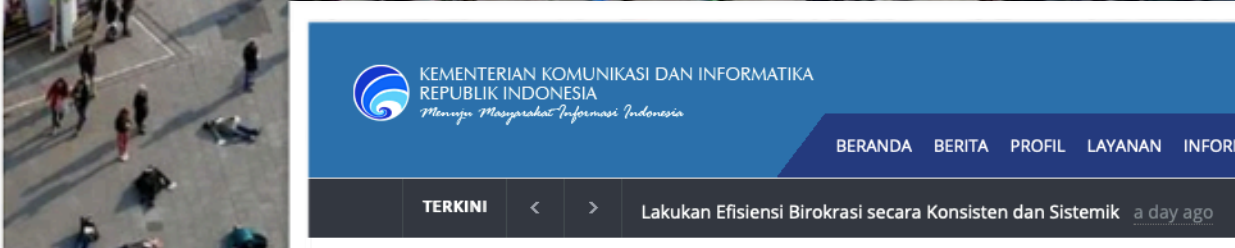
Foto hoax korban virus corona